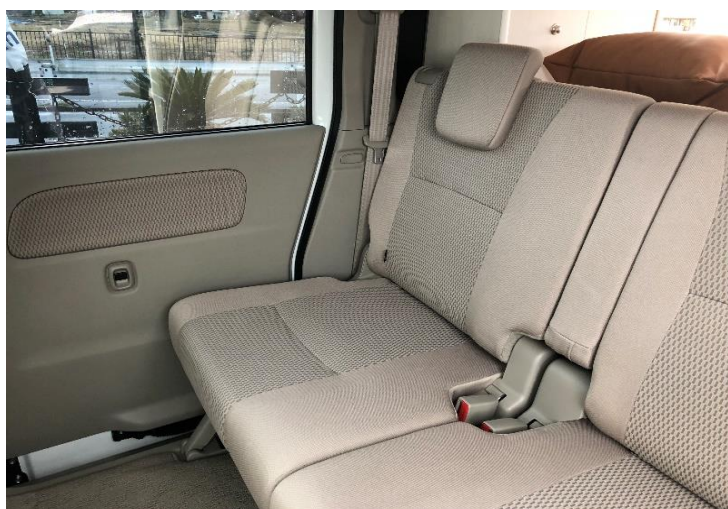
①ノブを引いて背もたれを倒す