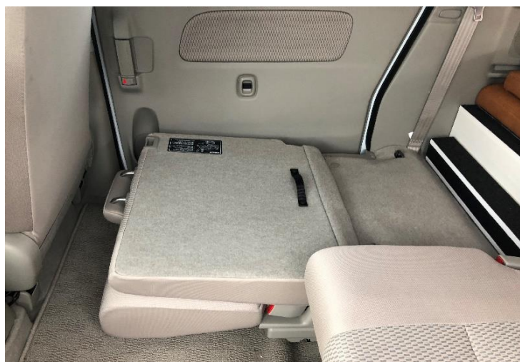
③収納後マットにスペーサーを設置する。