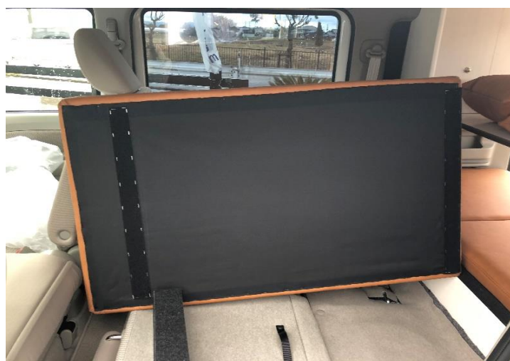
④マジックテープ部分を接着する。