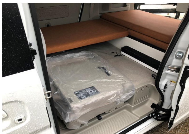
⑥片側完成ベットになりました。