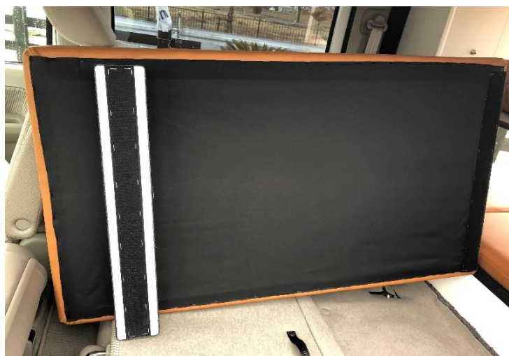
⑤前後のマジックテープを合わせてはめ込む。