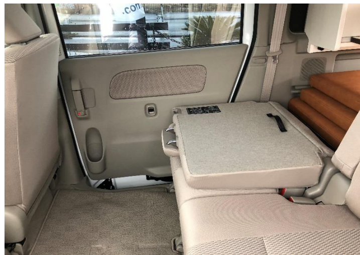
②背面の黒いベルトを引上げシートを収納する。